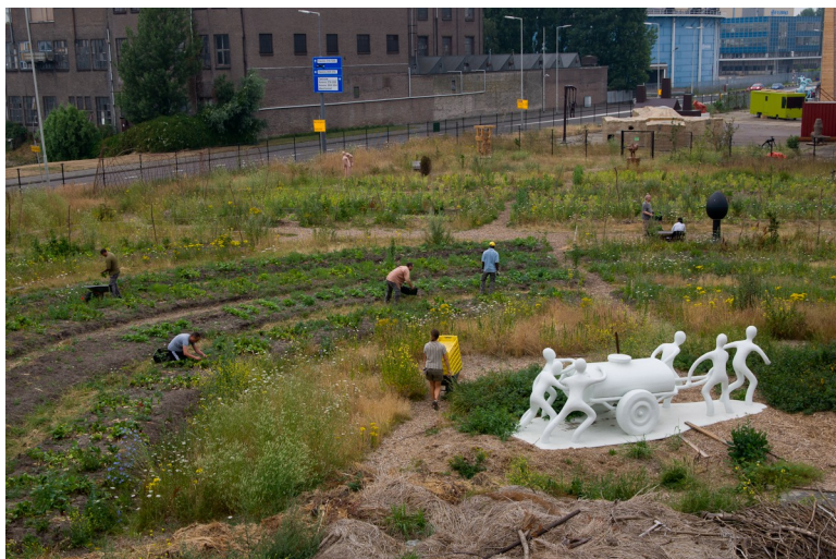
Met beeld van Joep van Lieshout

Tevens levert de tuin (en de ontwikkeling daarvan) een grote bijdrage aan de gebiedsontwikkeling, mede omdat we er ook een (buurt)park van maken met picknickplekken e.d.